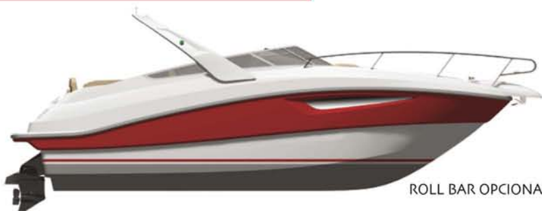
ROLL BAR OPCIONAL